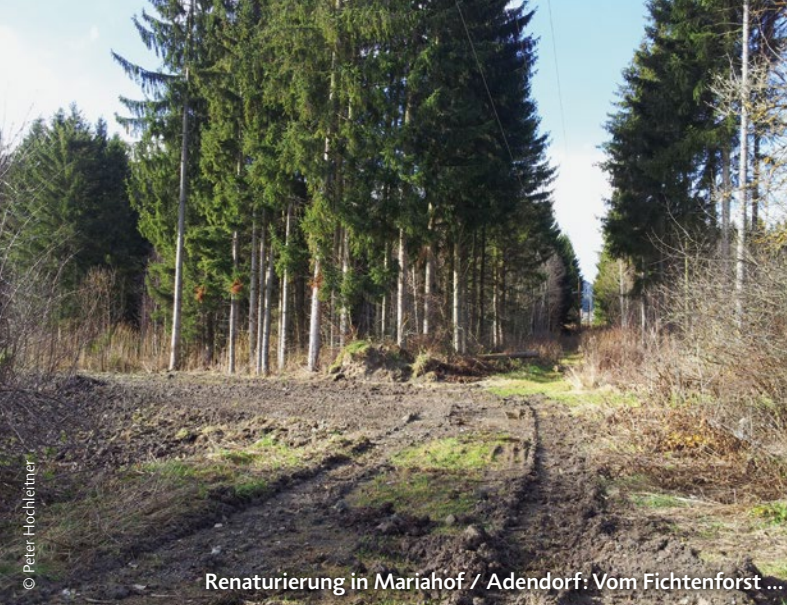
Renaturierung in Mariahof / Adendorf: Vom Fichtenforst ...