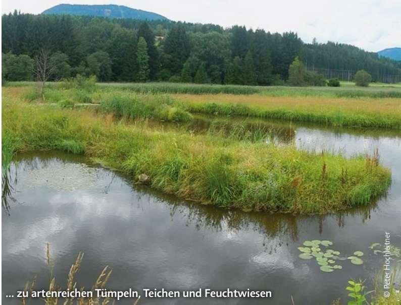
... zu artenreichen Tümpeln, Teichen und Feuchtwiesen